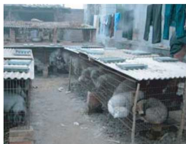
Dans les élevages chinois, les renards, les chiens viverrins, les visons et les lapins sont confinés dans d'étroites cages grillagées.

La peur est la source de stress physiologique, d'infanticides et de comportements pathologiques, connus sous le nom de stéréotypie.